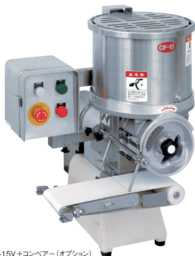
CF-15V+コンベアー(オプション)

コロッケやハンバーグ、ミートボールなどの成型に最適。使い勝手、省スペース性に優れる小型と卓上型をラインナップ。小型はシリンダー方式で、卓上型はドラム方式を採用しています。