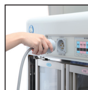
マグネットコンセント

着脱が簡単・確実なマグネットコンセントや漏電ブレーカーを搭載。安心して作業が行えます。