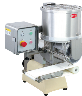
CF-15V+ コンベアー (オプション)

コロッケやハンバーグ、ミートボールなどの成型に最適。使い勝手、省スペース性に優れています。