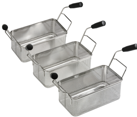
■ボイル用ステンレスかご